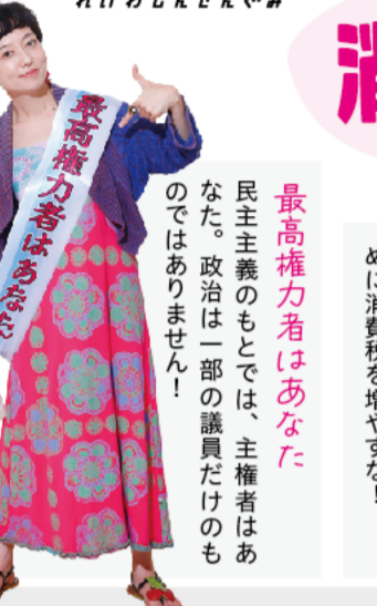
最高権力者はあなた 民主主義のもとでは、主権者はあなた。政治は一部の議員だけのものではありません！